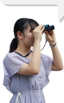
理学部化学科 編集者 N.M.