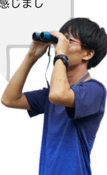
理学部生物科学科 編集者 R.S.

宇宙に関する丁寧な説明や、実際に月の砂を見せてくださり、とても学生思いの先生だと感じました。