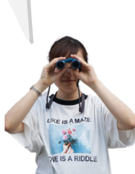
理学部生物科学科 編集者 H.M.